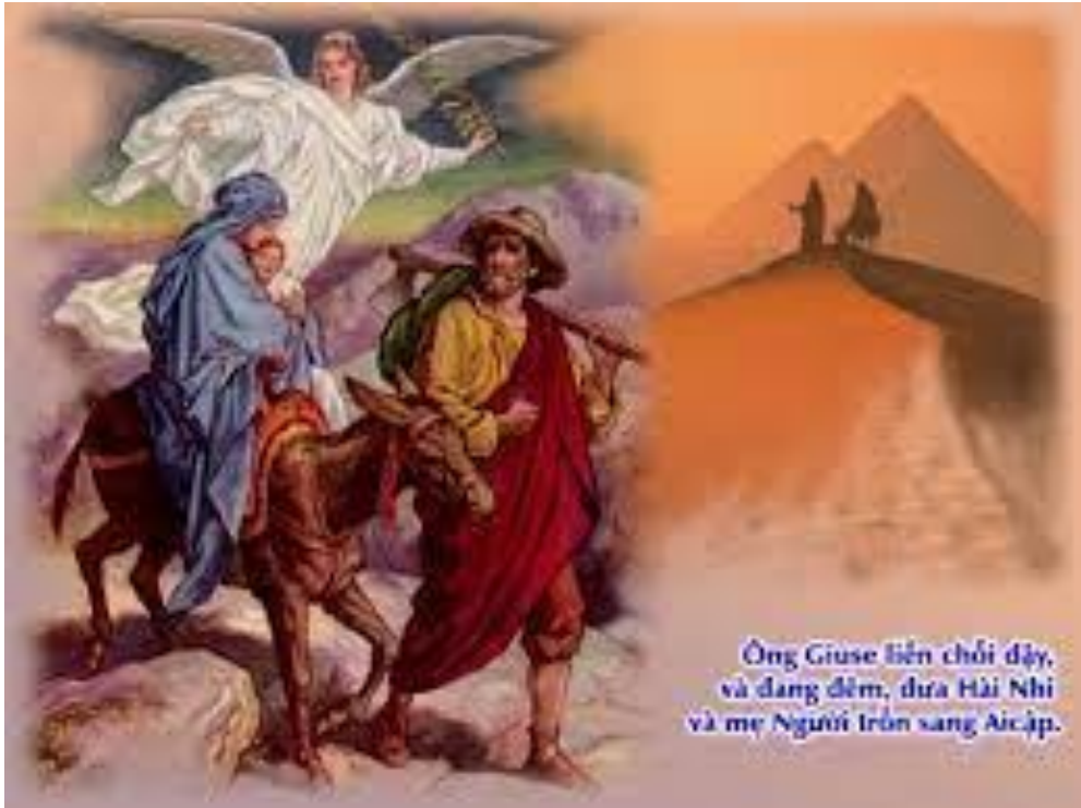
Ông Giuse lên chổi dậy, và đang đêm, đưa Hài Nhi và mẹ Người trốn sang Ai Cập.

Chúa Sau khi các nhà chiêm tinh ra về, sứ thần Chúa hiện ra báo mộng cho ông Giuse đem Hài Nhi và Mẹ Người trốn sang Ai Cập vì vua Hêrôđê sắp tìm giết Hài Nhi.